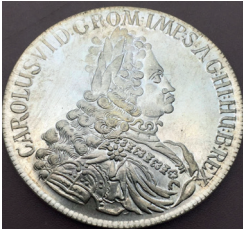
III. (Roma Parası)