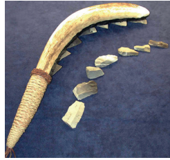
IV. (Sümerlere ait orak)

Yeni açılacak bir müze için "Tarih Öncesi Devirlerde İnsanlık" adlı bir katalog hazırlamayı düşünen bir araştırmacının yukarıda verilen eserlerden hangilerini kataloğa koyması doğru olmaz?