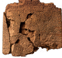
II. (Kadeş Antlaşması)